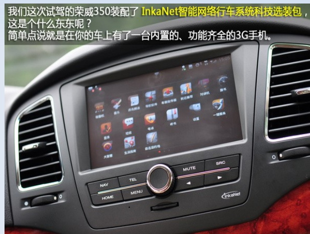
車載システム 上海汽車「Roewe350」