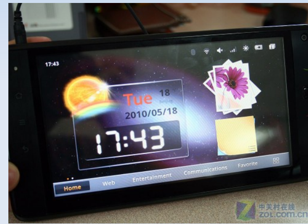
華為(HHuawei) Smakit S7