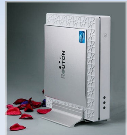
セットトップボックス 天幕 H3